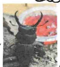
くーちゃんバイバイ...